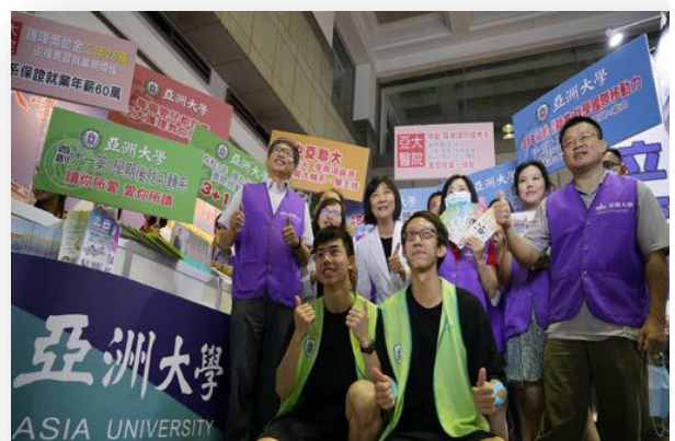
圖：招生處行政團隊參加大學博覽會