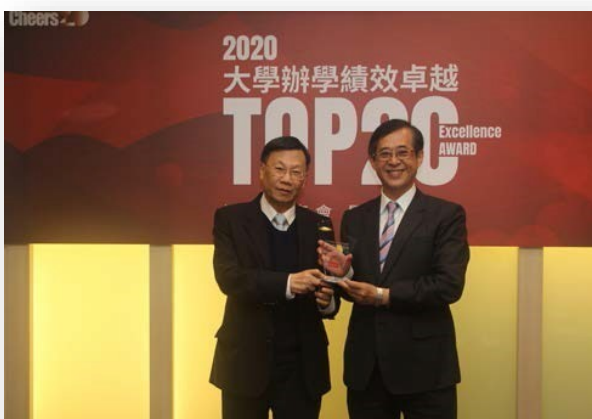
圖：大學辦學績效 TOP20，全台第 9 名！