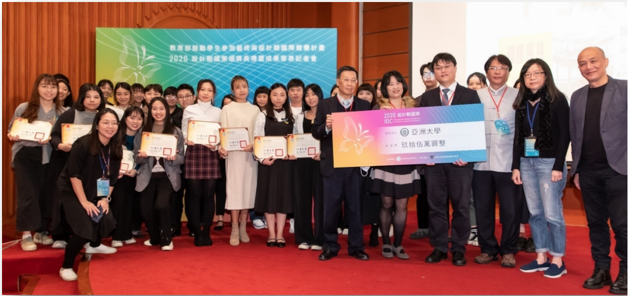
圖：亞洲大學獲國際設計競賽 7 年高教第一！

校址：台中市霧峰區柳豐路 500 號 招生諮詢專線：04-23323456#3132~3135 網址： https://rd.asia.edu.tw