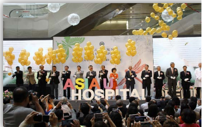
圖：亞洲大學附屬醫院